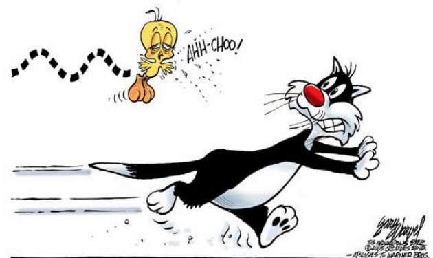
Grippe aviaire... suite

Rendez-vous donc dans quelques mois pour une exposition hors du commun.